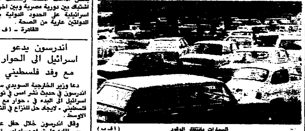
السيارات بانتظار الوقود

قال فيوتاس لانسرغيس رئيس جمهورية ليتوانيا امس ان الجمهورية ستصد امام العقوبات الاقتصادية التي فرضتها موسكو عليها، واضاف الرئيس لانسرغيس قوله للقاءة الثانية ببارتليون الفرنسي ليتوانيا يمكنها ان تصمد ١٠٠ عام من دون غاز وبنظ. وحتى يقول حتى عام ١٩٤٤ كانت ليتوانيا تعيش على منتجاتها المحلية. وكان لها اقتصاد مستقل. ان يمكنها الحفاظ على استقلالها. وقد قطعت الحكومة السوفياتية امس امدادات الغاز الطبيعي الى ليتوانيا بعد اقل من يوم واحد من قطعها امدادات النفط الى الجمهورية التي اعادت استقلالها عن الاتحاد السوفياتي في ١١ آذار الماضي.